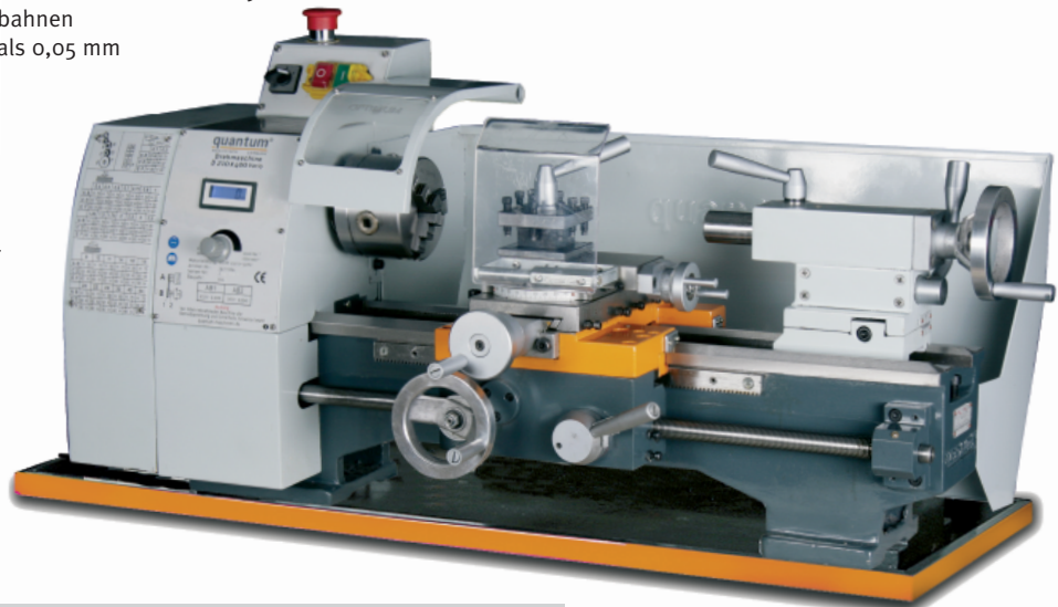
Abb.: D 210 x 400 Vario